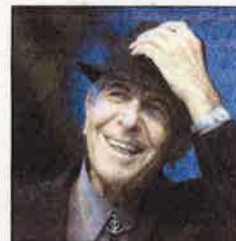
HYLLES: Montreal vil hylle sin store sønn med minneutstilling.

Leonard Cohen får sin egen minneutstilling i fødebyen Montreal i Canada. Utstillingen åpner i november i Museet for samtidskunst. Utstillingen skal hylle den verdenskjente sangerens liv og virke og vise hvilken innflytelse han også hadde på andre artister. Den skal også inneholde videoinstallasjoner og andre bidrag gjort av andre kunstnere som har blitt invitert av museet til å bidra til utstillingen. Leonard Cohen døde i november i fjor, 82 år gammel.