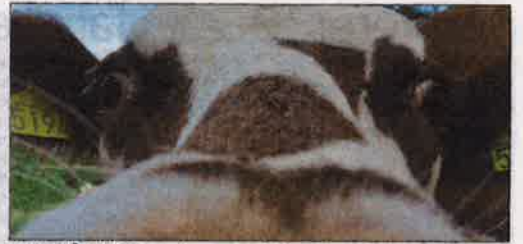
KUA MÅ MED: Et utsnitt av et av bildene på utstillingen. Kua er Langøyas viktigste grovarbeider.