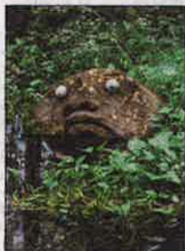
DRAUG: Er det slik draugen egentlig ser ut?